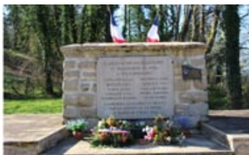
Monument aux maquisards d'Alièze