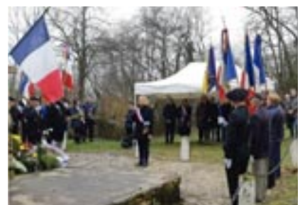
Cérémonie à Alièze le 14 mars 2023