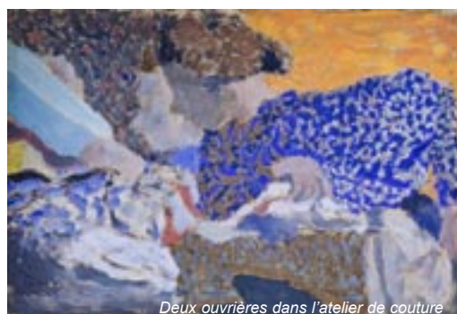
Deux ouvrières dans l'atelier de couture