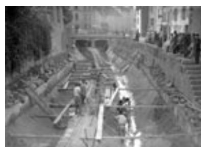
Les travaux de couverture de la Vallière