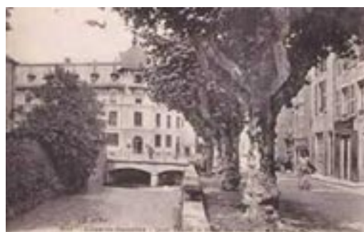
Le quai Thurel avant les travaux