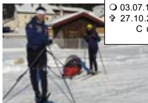
Vacances à Bois-d'Amont en famille