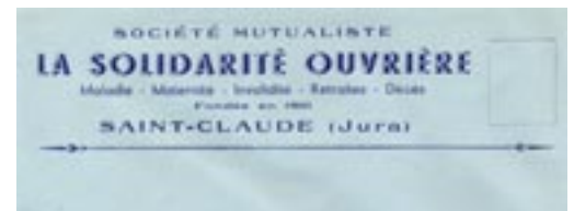
Entête de la mutuelle