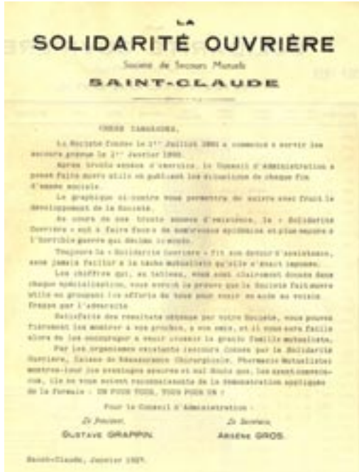
Circulaire de Janvier 1921 de la Solidarité Ouvrière