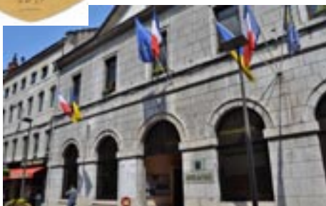
L'Hôtel de ville de Saint-Claude