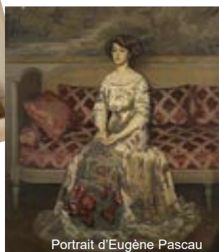
Portrait d'Eugène Pascau

GÉRARD Louise Rose Étienne dite Rosemonde ○ 05.04.1866 Paris 8 e (75) † 08.07.1853 Paris 16 e (75) x 08.04.1890 Paris 8 e (75) Edmond ROSTAND poétesse et comédienne