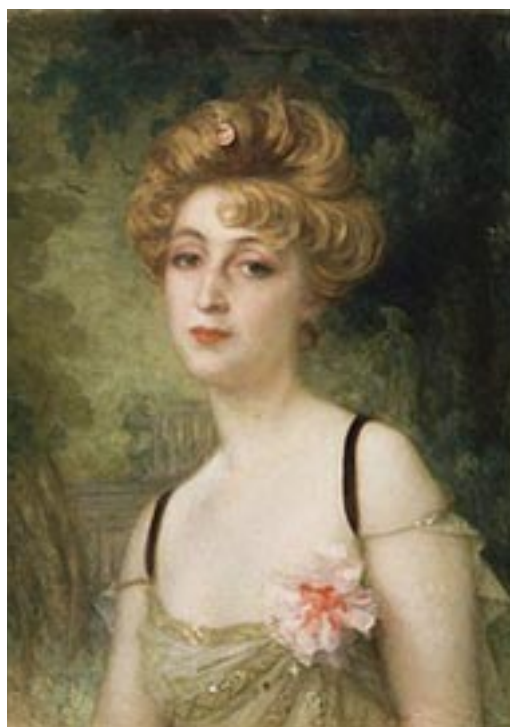
Portrait par Ernest Hébert en 1901

Née de parents inconnus chez une sage-femme du 8 e arrondissement de Paris, la petite Louise Rose sera reconnue par son père le 6 janvier 1868, sa mère, déjà mariée à un comte anglais et mère de deux enfants, sera officiellement sa tutrice mais ne la reconnaîtra pas.