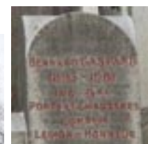
Monument au cimetière du Père-Lachaise à Paris