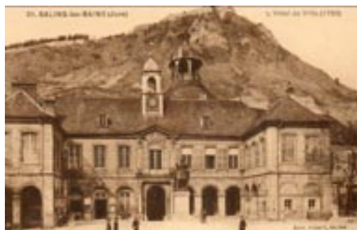
L'hôtel de ville de Salins