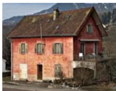
Le Crédit Agricole de Salins