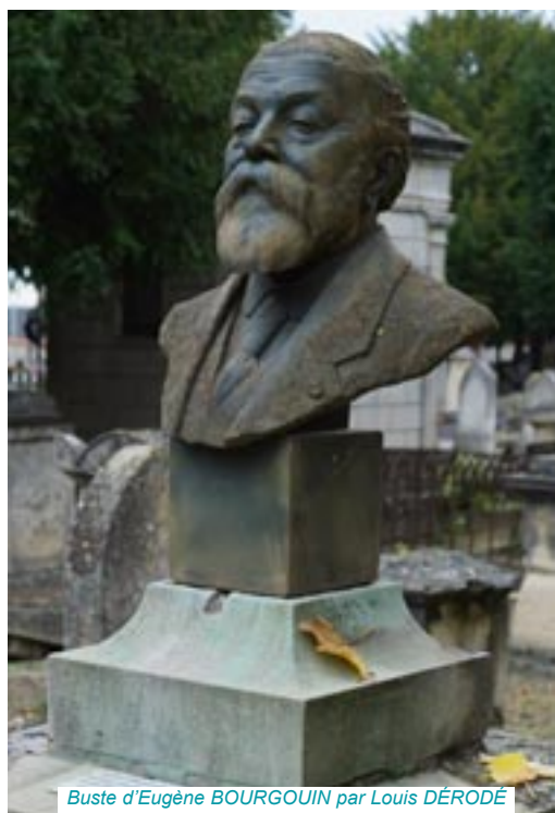
Buste d'Eugène BOURGOUIN par Louis DÉRODÉ

Pour réaliser le monument aux morts de la première guerre mondiale 1914-1918, la ville de Salins-les-Bains (Jura) choisit de confier ce projet à l'architecte dijonnais Auguste DROUOT. Ce dernier fait appel au sculpteur rémois Eugène BOURGOUIN pour en réaliser la statuaire. Le monument sera inauguré le 11 novembre 1926, après la mort du sculpteur.