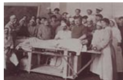
Avec son équipe à l'Hôtel-Dieu