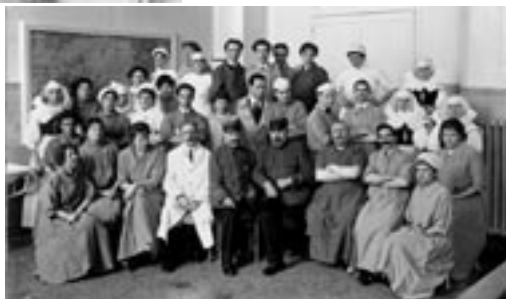
Pendant la guerre de 14-18