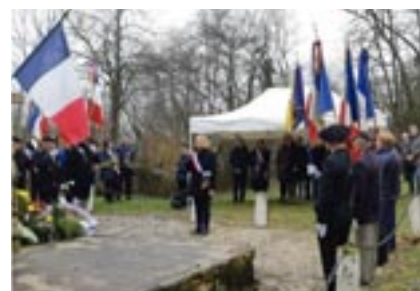
Cérémonie à Alièze le 14 mars 2023