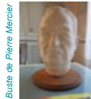
Buste de Pierre Mercier