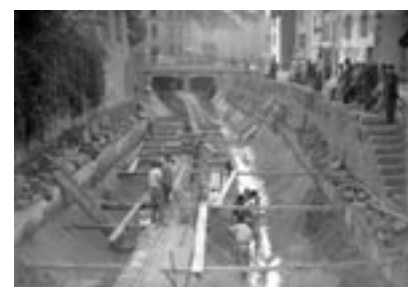
Les travaux de couverture de la Vallière