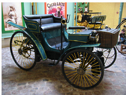
Peugeot type 3 (1892) Musée de l'Aventure PEUGEOT à Sochaux