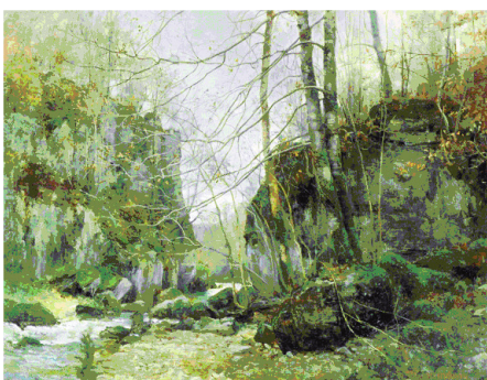
Le ravin de la Brême - 1879 - Musée des Beaux Arts de Besançon