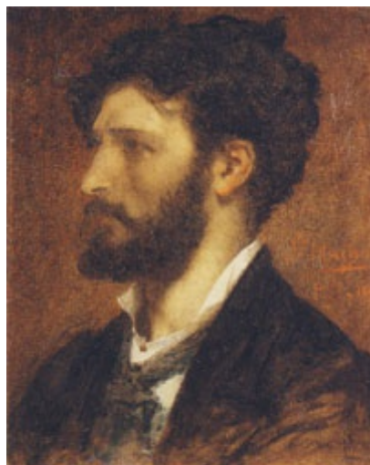
Autoportrait Huile sur toile, 47x37, 1865 Rome, Académie de France, Villa Médicis