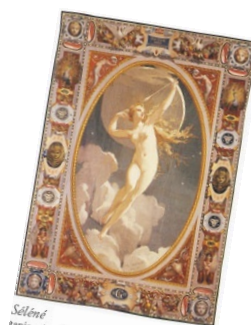
Sélééné reproduction, 1874 Paris, Mobilier National