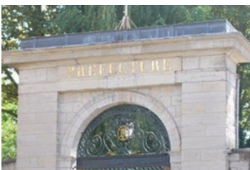
Entrée d'honneur de la préfecture du Jura