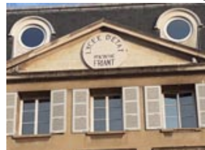
Le Lycée Friant à Poligny