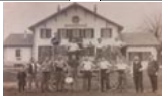
le personnel de l'ENIL