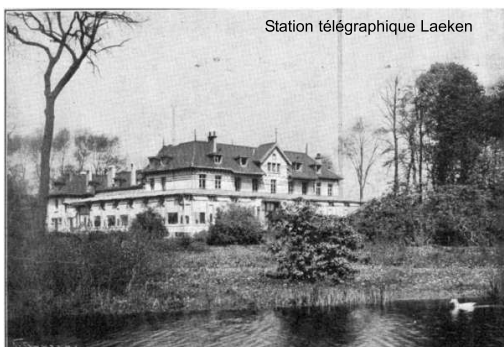
Station télégraphique Laeken