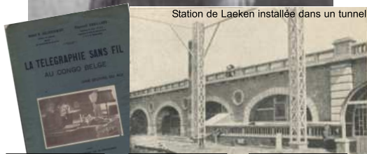
Station de Laeken installée dans un tunnel