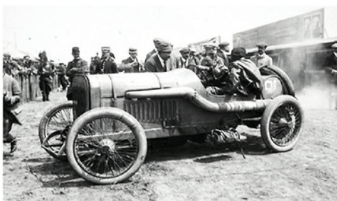
Grand Prix de Dieppe 1912