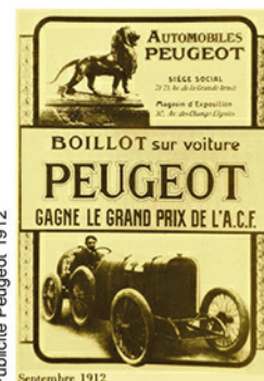
Publicité Peugeot 1912