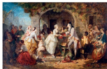
Faustin Besson Boucher et Rosine ou l'amour de Boucher, 1881 Coll. Part.