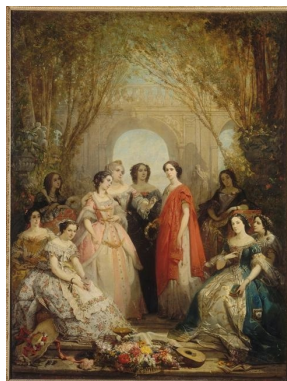
Les dames sociétaires de la Comédie Française