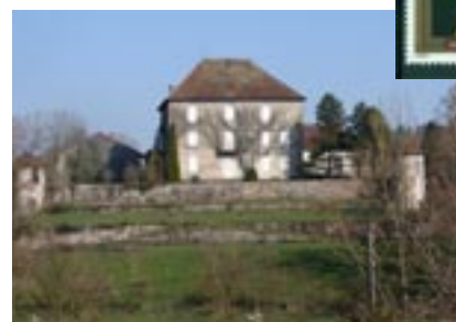
Le château de Moutonne