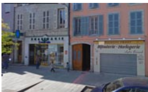
La pharmacie Prost en 2009