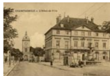
L'hôtel de ville de Champagnole