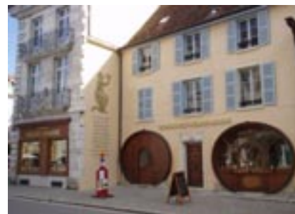
Les Deux Tonneaux à Arbois (39)